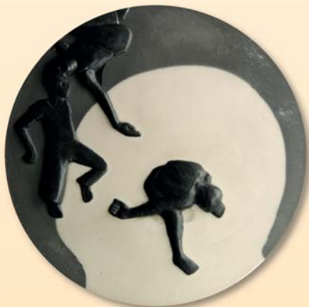
Anne Karen Hentschel, Medaille „Übergang I“, 2013, Acryl, Ø 90 mm

hier die zwei grundverschiedenen Herangehensweisen zur Erlangung von Kenntnissen.