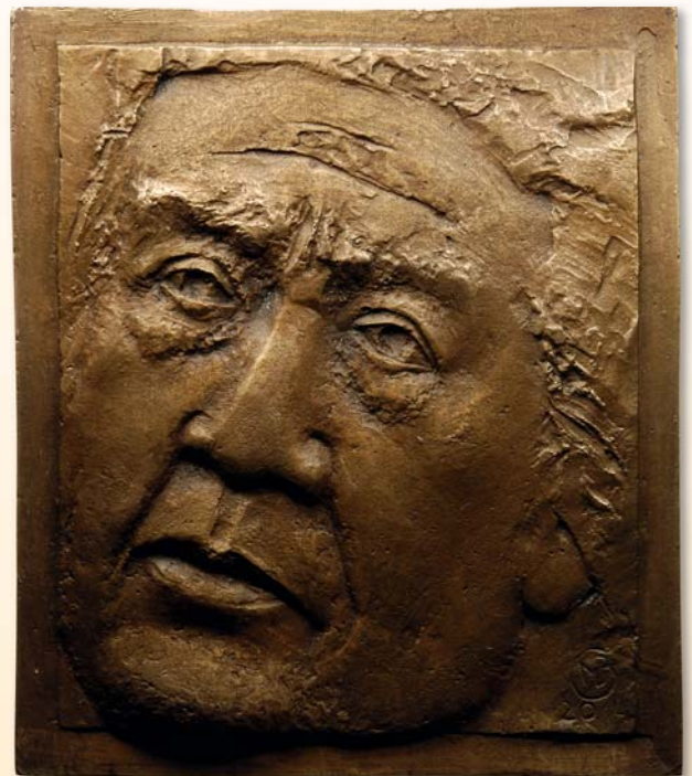
Marie-Luise Bauerschmidt, Plakette „Sergiu Celibadache 1912–1996“, 2014, Bronze, 128 x 122 mm