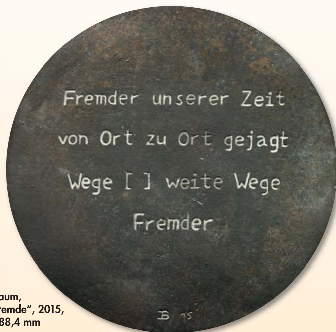
Julia Baum, Medaille „Der Fremde“, 2015, Bronze, Ø 88,4 mm