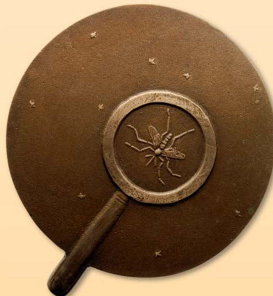
Andreas A. Jähmig, Medaille „Wissen“, 2015, Bronze, Ø 90 mm