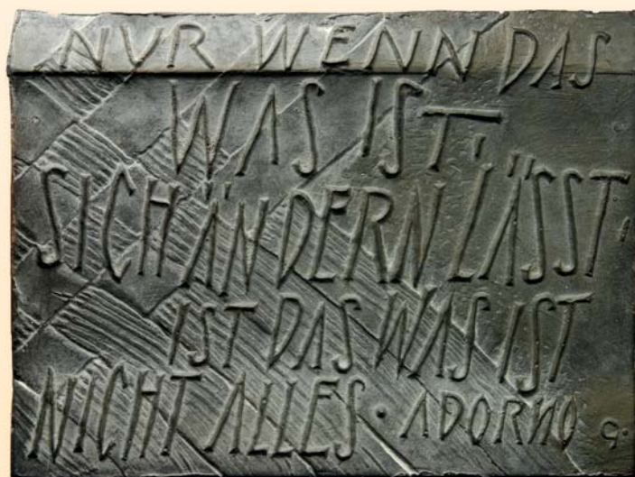
Bernd Göbel, Plakette „Zu Adorno“, 2014, Bronze, 139 x 104 mm