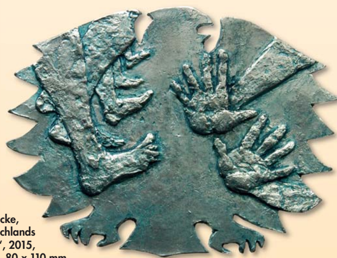
Katrin Pannicke, Medaille „Deutschlands Pro und Contra“, 2015, Bismut-Zinn-Legierung, 80 x 110 mm