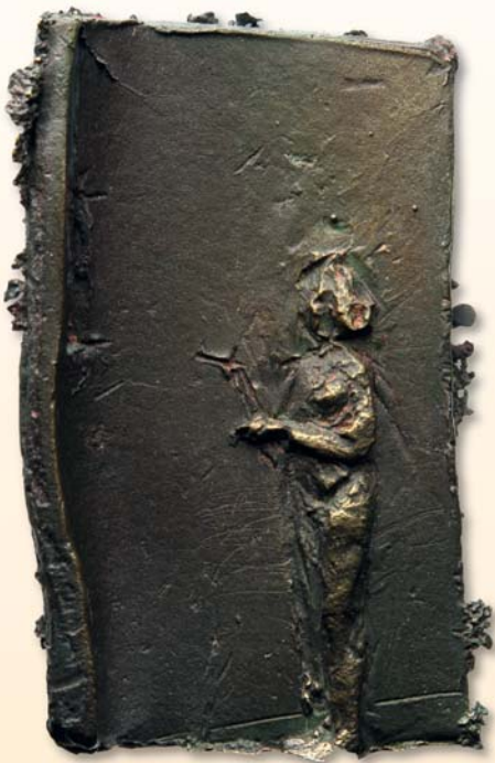
Boris Schwencke, Plakette „Melancholie“, 2011, Bronze, 65 x 40 mm