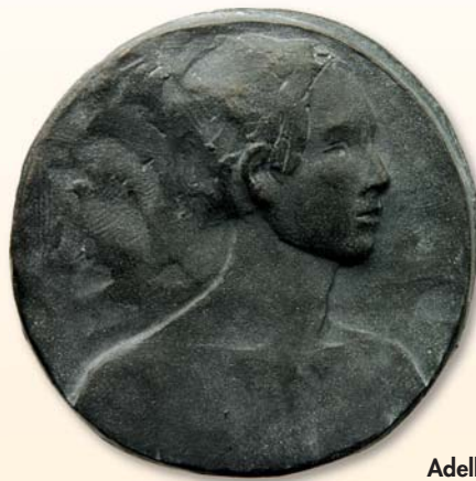
Adelheid Fuss, Medaille „Flüstern“, 2012, Bronze, 47 x 49 mm