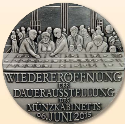
Peter-Götz Güttler / 1. Dresdner Medaillenmünze Glaser & Sohn GmbH, Medaille „Wiedereröffnung der Dauerausstellung des Münzkabinetts Dresden“, 2015, Silber, Ø 50,4 mm