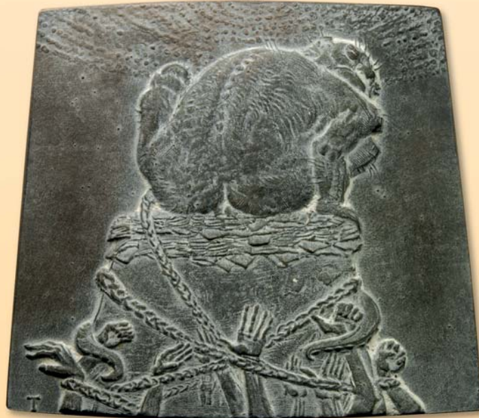
Carsten Theumer, Plakette „Bonds“, 2014, Bronze, 120 x 130 mm