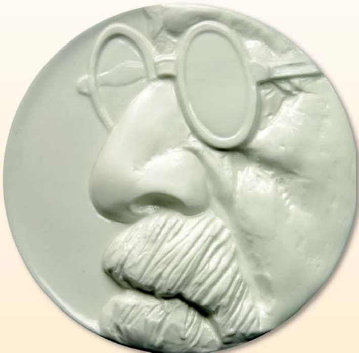
Olaf Stoy, Medaille „Zum 75. Todestag von Sigmund Freud“, 2014, Porzellan, teilweise glasiert, Ø 111 mm