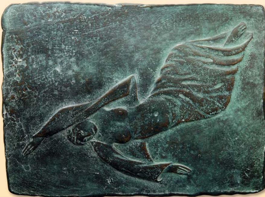
Wolfgang Friedrich, Plakette „Der Sturz“, 2014, Bronze, 108 x 147 mm

die nun durch bereits zwei- oder dreimalige Teilnahme an den Ausstellungen mit erfrischender Formensprache an Bekanntheit gewinnen. Nach wie vor verdeutlicht die Namensliste, dass die moderne Kunstmedaille vor allem in den Regionen um Halle (Saale), Berlin und Dresden gepflegt wird, ansonsten aber auch an etlichen weiteren Orten in anderen Teilen Deutschlands vertreten ist.