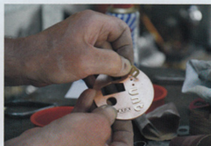
Montage van de penning

een artikel in het maartnummer 2015 over de medailleur autodidact. Over het werk van Jasperse schrijft hij: 'Voor hem vormt staal een onuitputtelijke bron van inspiratie, mede door de grillige structuren, het vuur, met daarbij de wisselende kleuren. Hij werkt met titanium, messing, koper, zink en staal, die alle een andere bewerking ondergaan, Titanium is lastig te bewerken, maar dat past wel bij hem, aldus de metaalbewerker. Messing is heel meegaand en koper is wat star, Staal is daarentegen voor hem intrigerend, het vuur, de kleuren, het druipen naar gewenste vormen, het blijft hem fascineren, Als handwerksman zegt hij: Ik probeer mijn brander.